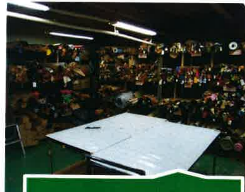
資材ストック置場