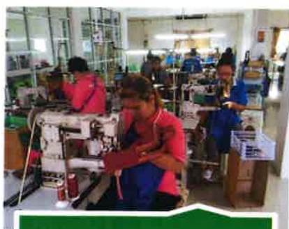
工場2F・アームシン